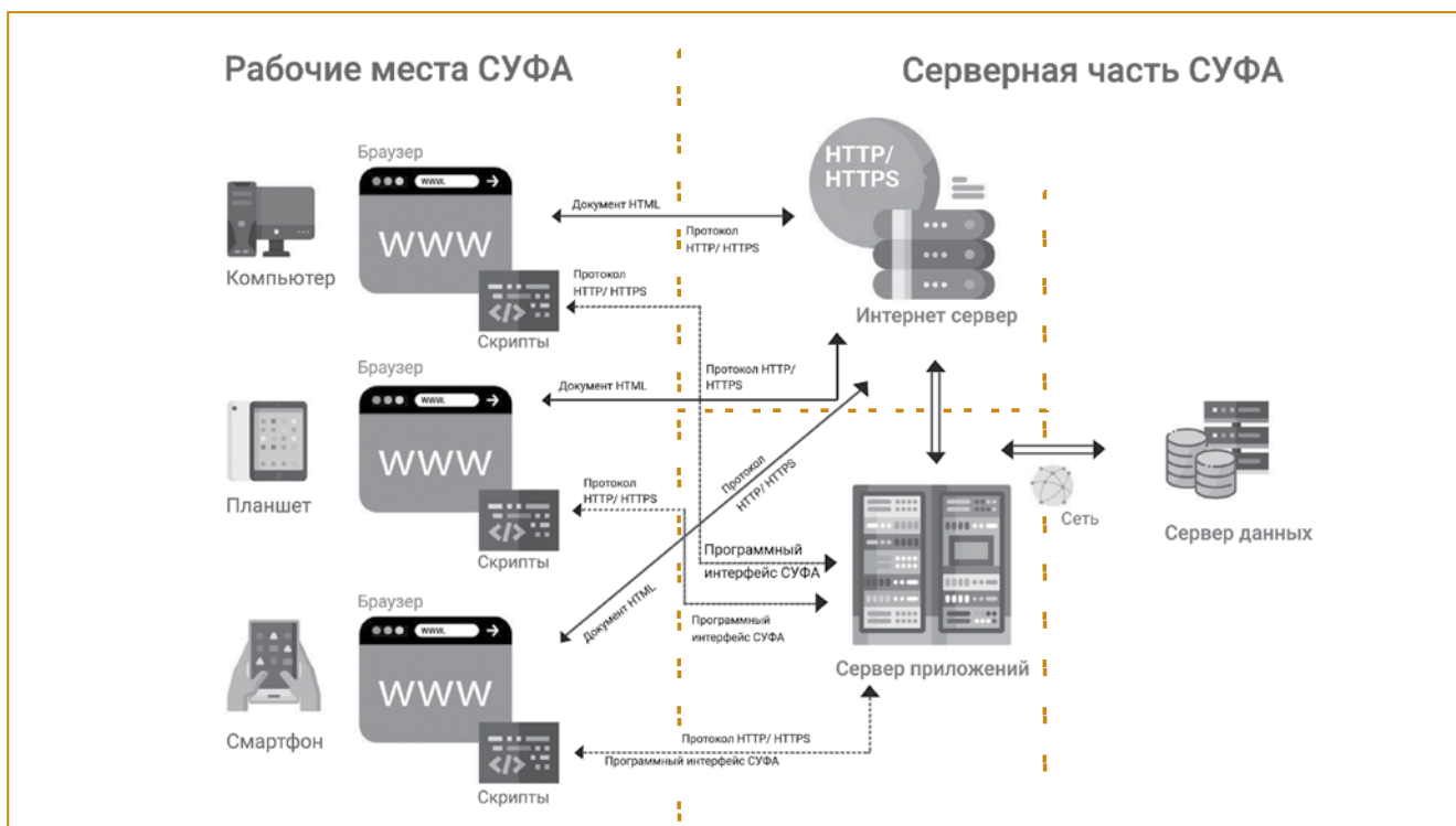
Рис. 2. Взаимодействие рабочих мест с ИСУФА через Web-интерфейс

вовлечения персонала предприятия в процессы, реализуемые в ИСУФА.