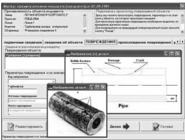
Рис. 2. Пользовательский интерфейс для описания прецедентов

тродействия поиска аналогов авторами был разработан подход к индексированию прецедентов, обеспечивающий построение индексов, включающих сведения о структурных свойствах механической системы, о признаках текущего технического состояния и их значениях. Использование данного подхода к индексированию позволяет учитывать субъективные предпочтения исследователей при поиске (извлечении) аналогов и особенности предметной области при применении методологии Case-based reasoning для решения задачи идентификации.