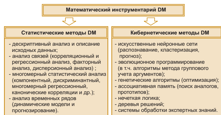
Рис.2. Математический арсенал Data Mining

Среди наиболее известных и популярных пакетов статистического анализа следует отметить Statistica, SPSS, Systat, Statgraphics, SAS, BMDP, TimeLab, DataDesk, S-Plus, Scenario (BI).