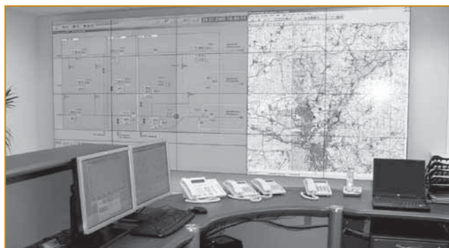
Рис. 2. Видеостена и АРМ диспетчера, отображающие видеоклады СОДУ

[3, 4] производства АО «АТГС», предназначенный для непрерывного автоматизированного контроля и управления технологическими и производственными процессами, а также предоставления диспетчерскому и производственному персоналу предметно- и объектно-ориентированной информации для принятия эффективных, своевременных и обоснованных решений по управлению этими процессами.