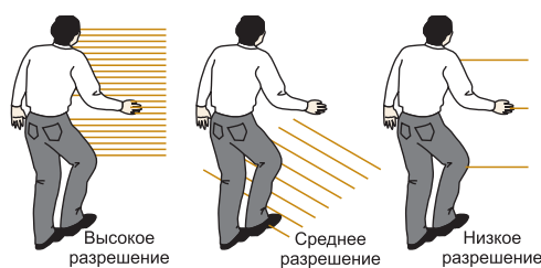
Рис. 1. Разрешающая способность

Система MINI-SCREEN имеет высокую степень безопасности, подтвержденную тестами по методике FMEA (Failure Mode and Effects Analysis), которая позволяет анализировать влияние отказов системы на ее безопасность.