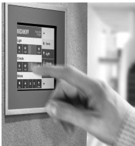
Рис. 1. Лицевая панель встраиваемой модели CP6608 серии Economy выполнена из алюминия. Фронтальная часть устройства имеет класс защиты IP 65, а тыловая – IP 20

Дополнительные соединения подключаются к устройству через 16-контактный разъем. Версия для автоматизации зданий включает также два стандартных порта Ethernet и два USB 2.0.