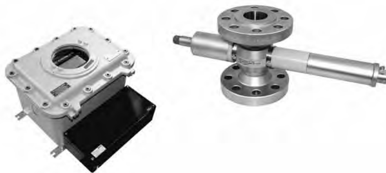
Рис. 1. Взрывозащищенная версия фотометрического анализатора

Выбор подходящего оборудования возможен при грамотной постановке задачи. Подробная техниче-