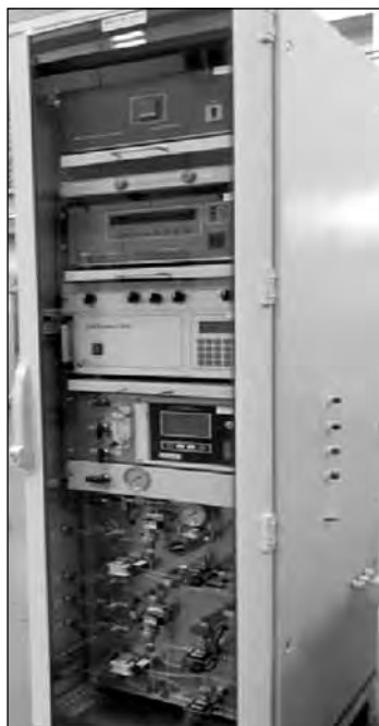
Рис. 3. Система анализа качества для мониторинга газовой среды

3. Термокаталитические методы используются в основном в стационарных газоанализаторах или датчиках загазованности и применяются