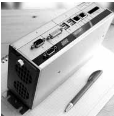
Рис. 2. Промышленные ПК серии C69xx предназначены для установки в шкафу управления

Наличие в качестве основы ОС РВ не гарантирует создание СРВ. Это лишь необходимое, но вовсе не достаточное условие. Помимо этого, для создания СРВ нужно пра-