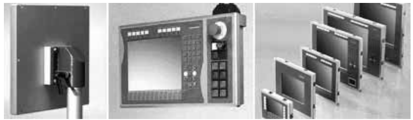
Рис. 5. Внешний вид панелей управления Beckhoff

Производительность CX1000 несопоставимо выше аппаратных контроллеров. Например, программа ПЛК, имеющая дело примерно с 1000 аппаратных сигналов (внутренних, программных переменных при этом больше в несколько раз) при заданном цикле задачи ПЛК,