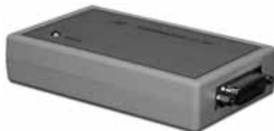
Рис. 1. Контроллер КОП-USB

Если параметры компьютера, КОП или прибора установлены неправильно, то драйвер не будет работать или будет работать неправильно. В реальной ситуации пользователь может не знать некоторых необходимых параметров, или не совсем верно понимать связь взаимодействующих частей системы, что может привести на первых этапах работы к большим или меньшим затруднениям. Частичным решением этой проблемы являются обучающие и тестовые программы, поставляемые с контроллером КОП, предлагаемым "Лабораторией автоматизированных систем (АС)" (рис. 3). В случае необходимости компания берет на себя "оживление прибора", разработку ВП, специализированных библиотек и элементов ActiveX, а также разработку систем автоматизации измерений и управления "под ключ".