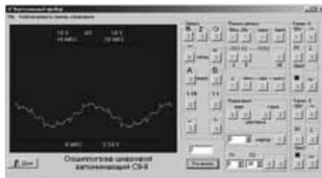
Рис. 4. "Виртуальный прибор" осциллограф С9-8 – интерфейс программы управления реального прибора через контроллер КОП

Примером реализации такого подхода могут служить "Логический анализатор" и "Генератор логичес-