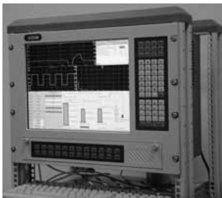
Рис. 8. Система автоматизации стендовых испытаний на базе комплекса АСTest

В 2002 г. комплекс АСTest был награжден медалью "Гарантия качества и безопасности" конкурса "Национальная безопасность". В настоящее время комплекс может рассматриваться как "стандарт де-факто" для решения задач данного класса. Некоторые