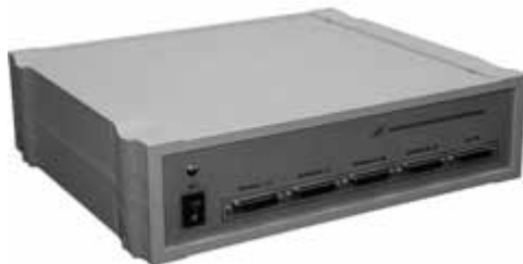
Рис. 6. Логический анализатор внешнего исполнения – подключение через USB порт

В Инженерном центре АСНИ ВП сразу стали разрабатываться как средства создания компонентов установок для проведения физических экспериментов. Во многом это диктовалось нашей бедностью, когда "живой" прибор был просто финансово не доступен. Это сразу заложило системность подхода в идеологию таких ВП, которые, будучи функционально полноценным аналогом реального прибора, одновременно являлись элементом интегрированной среды проектирования системы автоматизации эксперимента [4]. Практически именно эта идеология реализована в программном комплексе автоматизации экспериментальных и технологических установок АСTest [5] (Свидетельства РОСПАТЕНТ № 2003611340, 2003611315, 2003611341, 2003611342), разработанного в "Лаборатории автоматизированных систем (АС)". В настоящее время этот комплекс предлагается на рынке как законченный "коробочный" продукт (в версиях АСTest-Lite и АСTest), а так же как базовое средство для разработки систем под требования заказчика (в версии АСTest-Pro). АСTest сегодня имеет развитые средства визуализации данных в масштабе РВ. Кроме традиционных для систем автоматизации экспериментов средств визуализации таких, как мнемосхемы с цифровыми элементами, самописцы, табличные элементы имеются элементы визуализации,