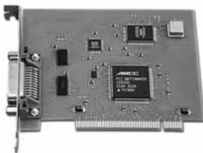
Рис. 2. Контроллер КОП-PCI