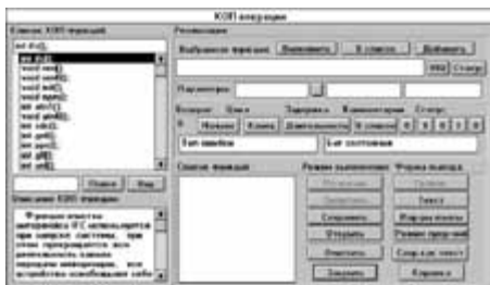
Рис. 3. Пример программы поддержки программирования контроллера КОП