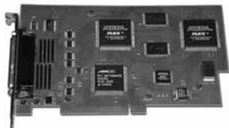
Рис. 5. Логический анализатор – вставная плата в РС1-шину