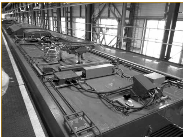
Рис. 4. Система контроля контактной сети

Система обзорного видеонаблюдения включает в свой состав камеры видеонаблюдения, расположенные в кабинах машинистов, и обеспечивает одно-временный «взгляд» на одну и ту же точку пути с двух сторон (рис. 6).