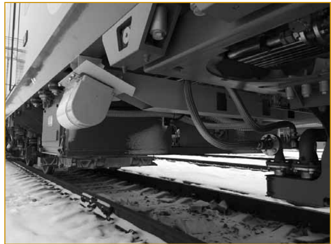
Рис. 5. Система пространственного сканирования

цессе движения. Наиболее важная информация, получаемая в ходе проезда, автоматически пересылается по выделенному радиоканалу заданным потребителям для оперативного принятия управленческих решений.