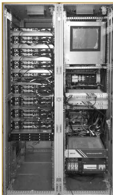
Рис.2. Оборудование с пультом системы управления

ИИС работает полностью в автоматическом режиме, не требует участия оператора, ведет регистрацию и обработку диагностической информации, вычисляет контролируемые параметры и осуществляет их оценку непосредственно в про-