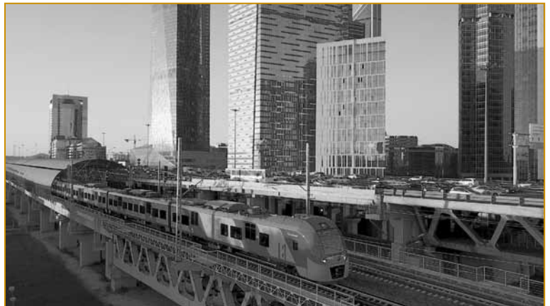
Рис. 1. Электропоезд «Ласточка» на МЦК

Проектом предусмотрено три этапа оснащения поезда «Ласточка» системами диагностики путевой инфраструктуры и контактной сети. На первом этапе была решена задача контроля наиболее ответственных параметров — геометрии пути и рельсов. На втором этапе произведено дооснащение высокоскоростной системой контроля контактной сети. На третьем этапе были уста-