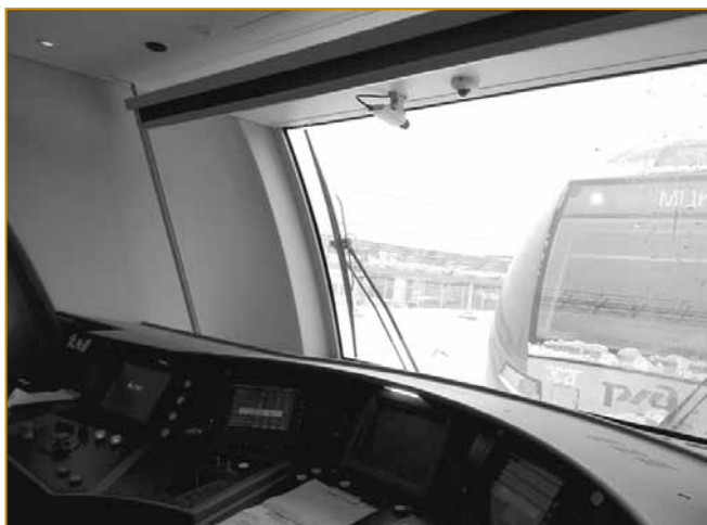
Рис. 6. Система обзорного видеонаблюдения