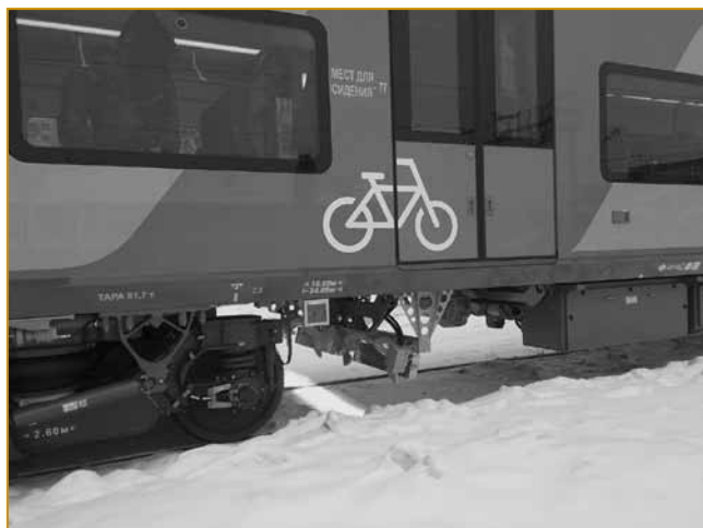
Рис 7. ИИС «ИНФОТРАНС-Ласточка»

Такую возможность предоставляет система синхронизации и позиционирования в железнодорожной и геодезической системах координат, которая синхронизирует все измерения, включая видеоданные, и привязывает их к единому сечению. Наряду с этим система отвечает за позиционирование в железнодорожной и геодезической системах координат. При наличии дифференциальных поправок от референчных станций глобальной навигационной спутниковой системы возможно получать пространственную привязку результатов измерения с точностью до 3 см.