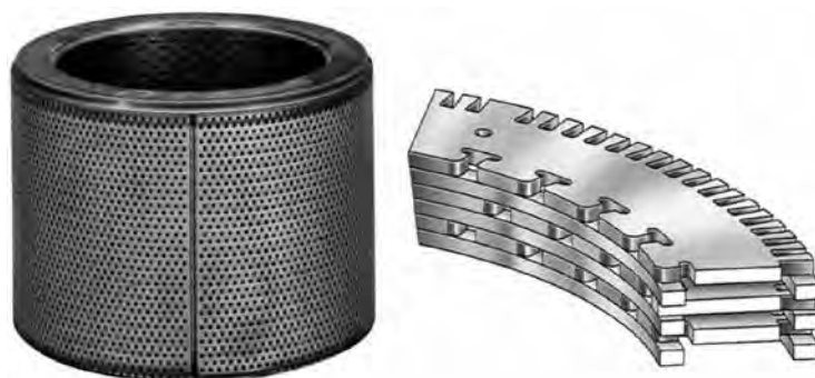
Рис. 3. Антишумовая клетка WhisperFlo™

Использование эффективных антишумовых клеток при сохранении большой пропускной способности требует перемещения плунжера в большем диапазоне, то есть требуется привод, обеспечивающий ход до 600 мм и более. Во всем диапазоне хода требуется точное перемещение с высокой скоростью, без коле-