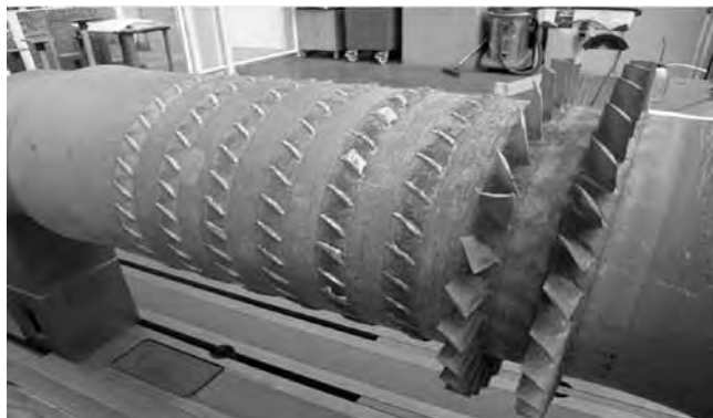
Рис. 1. Ротор компрессора в результате воздействия помпажа

антипомпажного клапана на ступени низкого давления уменьшит поток к ступеням высокого давления и тем самым подтолкнет их к помпажу. Поэтому для предотвращения помпажа на ступенях высокого давления клапаны вокруг каждой ступени должны открываться одновременно, каждый на определенную величину для стабилизации взаимодействующих антипомпажных контуров. Таким образом роль регулирующих клапанов в этой задаче становится критической. Здесь требуется быстрое реагирование и четкая управляемость для уверенности в том, что функции управления обеспечиваются должным образом, а также предотвращается взаимодействие ступеней компрессора. Все это требует функционирования регулирующих клапанов вне традиционных рамок. Важно, чтобы антипомпажный клапан мог обеспечить безопасную поддержку рабочего режима на максимально близком расстоянии к границе помпажа.