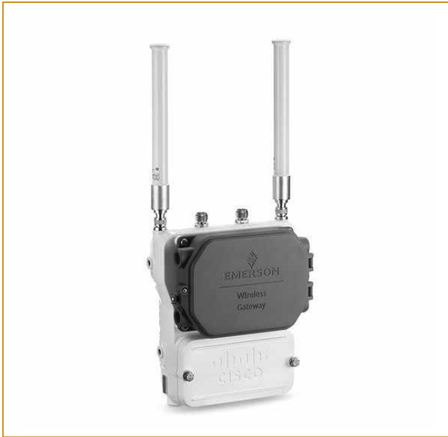
Рис. 2. Точка доступа IW6300

может быть инфраструктура, состоящая из беспроводного оборудования (шлюзы, датчики, планшеты, камеры видеонаблюдения и т.д.) и программных инструментов для управления потоками данных беспроводной сети предприятия. Преимущества беспроводных сетевых решений для завода — это сокращение капитальных затрат за счет отсутствия кабельной инфраструктуры, получение доступа к информации, которую раньше либо вообще невозможно было получить, либо доступ к ней требовал больших вложений. Кроме того, это гибкость настройки беспроводной сети, благодаря которой можно начать проект с решения небольшой локальной задачи, а затем постепенно расширять беспроводную сеть без затрат на инфраструктуру.