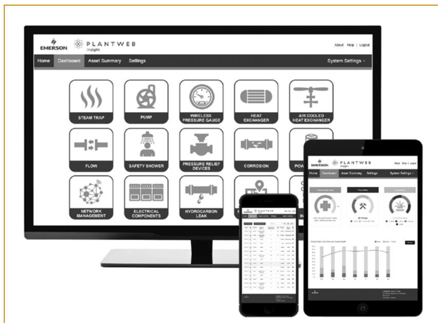
Рис. 3. Пакет приложений Plantweb Insight